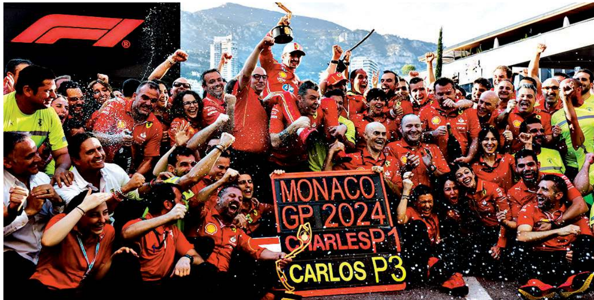
▲ Principato di Monaco Charles Leclerc festeggia la vittoria con tutto il team Ferrari